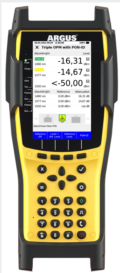
Figuur 3: ARGUS® 260 van intec, glasvezel combitester met alle noodzakelijke meet- en testfuncties.

Beschikt het meettoestel niet alleen over intelligente optiek en een assistent die een gerichte meting van het optisch vermogen bij verschillende golflengten mogelijk maakt, maar ook over een volwaardige GPON-chip, dan is het mogelijk om de PON ID in het geval van GPON uit het PLOAM-bericht via OMCI (ONT Management and Control Interface) of in het geval van XGS-PON als XGS-PON ID rechtstreeks uit het frame af te lezen en weer te geven (zie fig. 2 in fig. 2). De voor dit doel in de optiek geïntegreerde ontvangstdiodes moeten bijzonder geschikt zijn voor de snelle opeenvolging van gegevenspakketten.